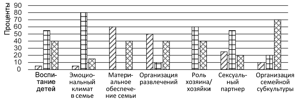
Рис. 1. Распределение ролей в семье (данные по юношам):

мейных ролей. Полученные результаты исследования представлены на рис. 1, 2.