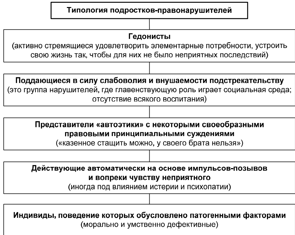
Рис. 2. Классификация подростков-правонарушителей, исходя из мотивов поведения по П. Г. Бельскому

Известные ученые, исследующие проблему подростковой и молодежной преступности, П. Г. Бельский и Г. М. Миньковский разработали типологию несовершеннолетних, совершающих правонарушения [23, 24]. Так, П. Г. Бельский, анализируя поведение и мотивацию поступков несовершеннолетних правонарушителей, подчеркивает их инфантильность в эмоциональном развитии, что представлено на рис. 2.