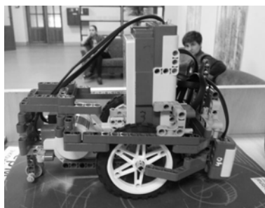
Рис. 1. Робот с датчиком

Завершает освоение программы раздел «Датчики», который служит для обобщения ранее изученного. Здесь ребята самостоятельно моделируют свои проекты, применяя датчики-сенсоры, благодаря которым конструкции становятся автономными (рис. 1) [5].