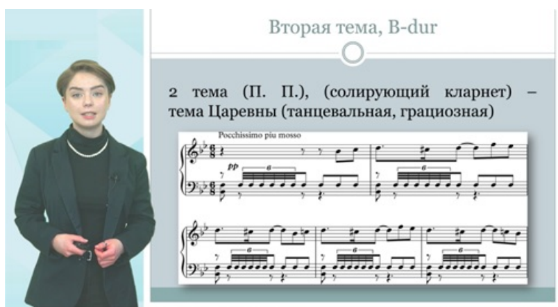
Рис. 1. Фрагмент мультимедийной лекции

Другим таким средством можно назвать авторскую разработку – мультимедийную лекцию . Создание полноценного курса мультимедийных лекций позволяет осуществить целостное изучение учебной дисциплины, совместить и отобразить аудио- и видеоматериалы, текстовый и графический материал с применением компьютерной анимации. Данный курс лекций совмещает технические возможности компьютерной и аудиовидеотехники в предоставлении учебного материала с живым общением лектора с аудиторией (рис. 1).