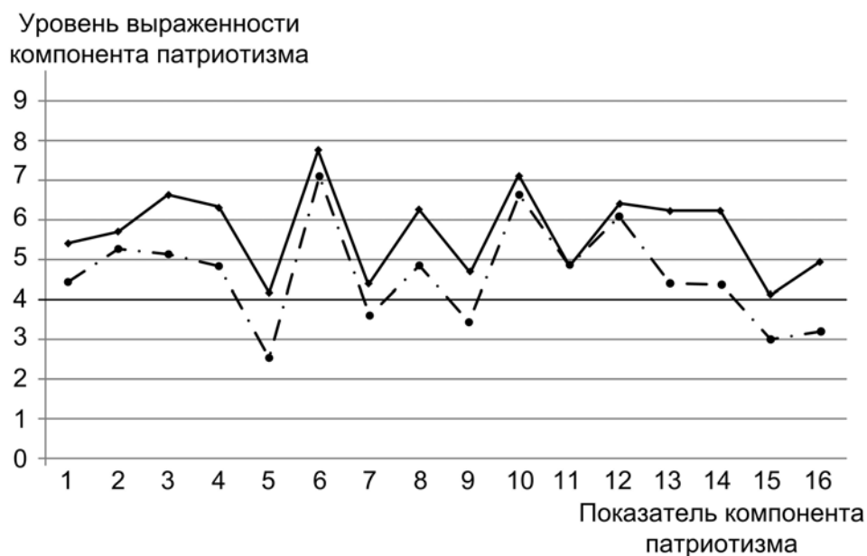
Рис. 3. Средние показатели выраженности содержательных характеристик патриотизма:

9–10 – шкала мотивационных характеристик (социоцентризм – эгоцентризм); 11–12 – шкала когнитивных характеристик (осмысленность – осведомленность); 13–14 – шкала продуктивных характеристик (предметно-коммуникативные – субъектно-личностные); 15–16 – шкала характеристик типов затруднений (операциональные – личностные). В каждой шкале присутствуют гармоническая и агармоническая переменные. В итоге измеряются 16 показателей (рис. 3).